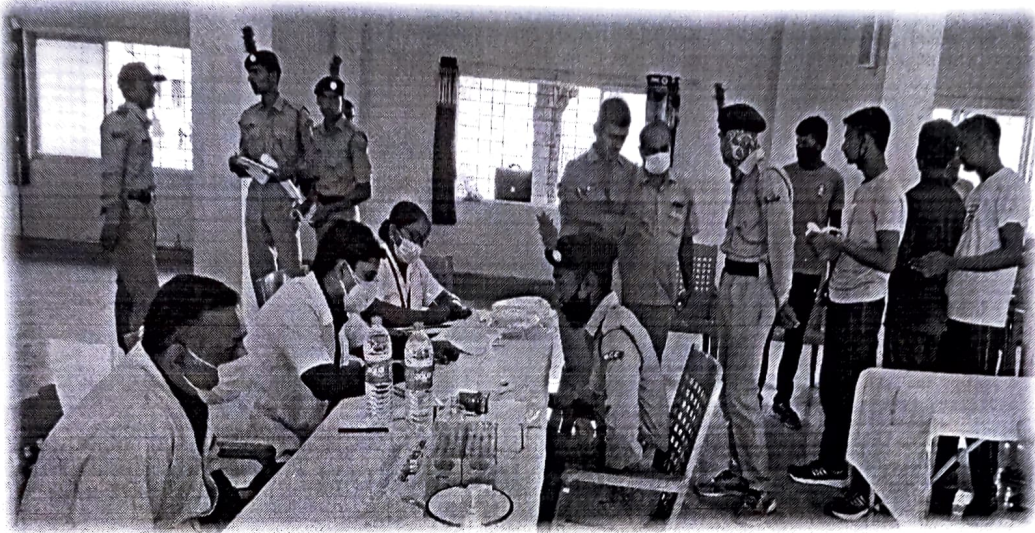
Doctors are checking volunteers before blood donation.